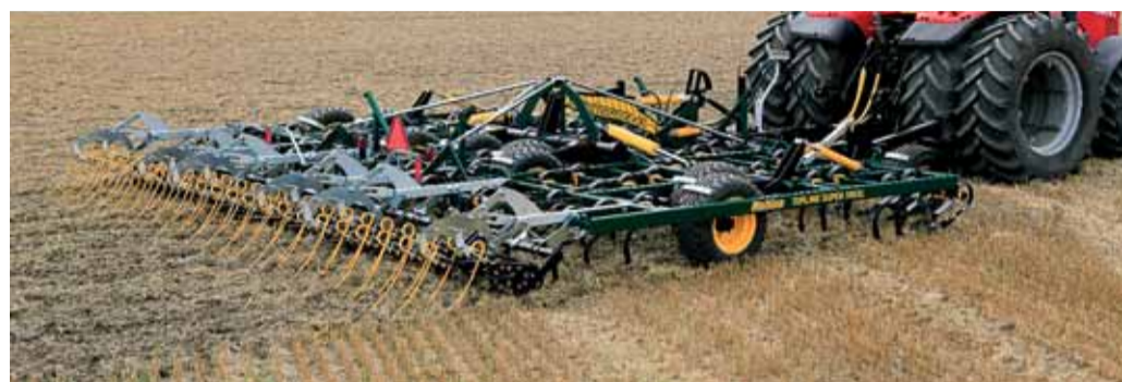
Topline Super XL pri podmiatke.

Vo verzii Topline Cross alebo Topline Super XL je možné na želanie stroj osadiť dvojradovými prstovými bránami.