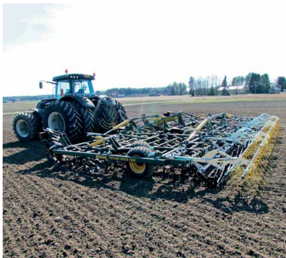
Multiva Topline Cross v kombinácii so zadnými prúťovými valcami a dvojradovými prstovými bránami.