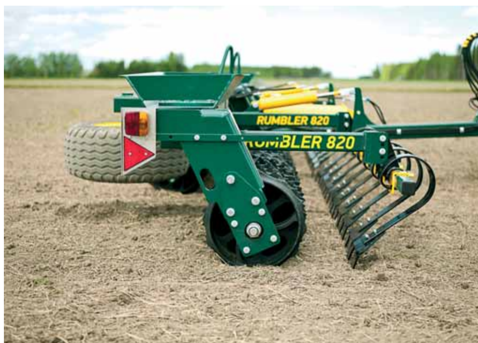
Multiva Rumbler 820 v pracovnej polohe s predným zrovnávacím smykom, ktorý je hydraulicky nastaviteľný.