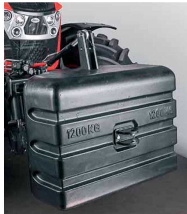
Prednú nápravu je možné doťažiť až 1200 kg závažím.

Objem palivovej nádrže traktora je 300 l a stroj disponuje aj 32 l nádržou na močovinu.