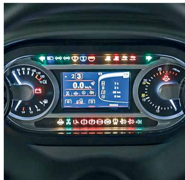
TFT displej na novej palubnej doske Crystal-u.