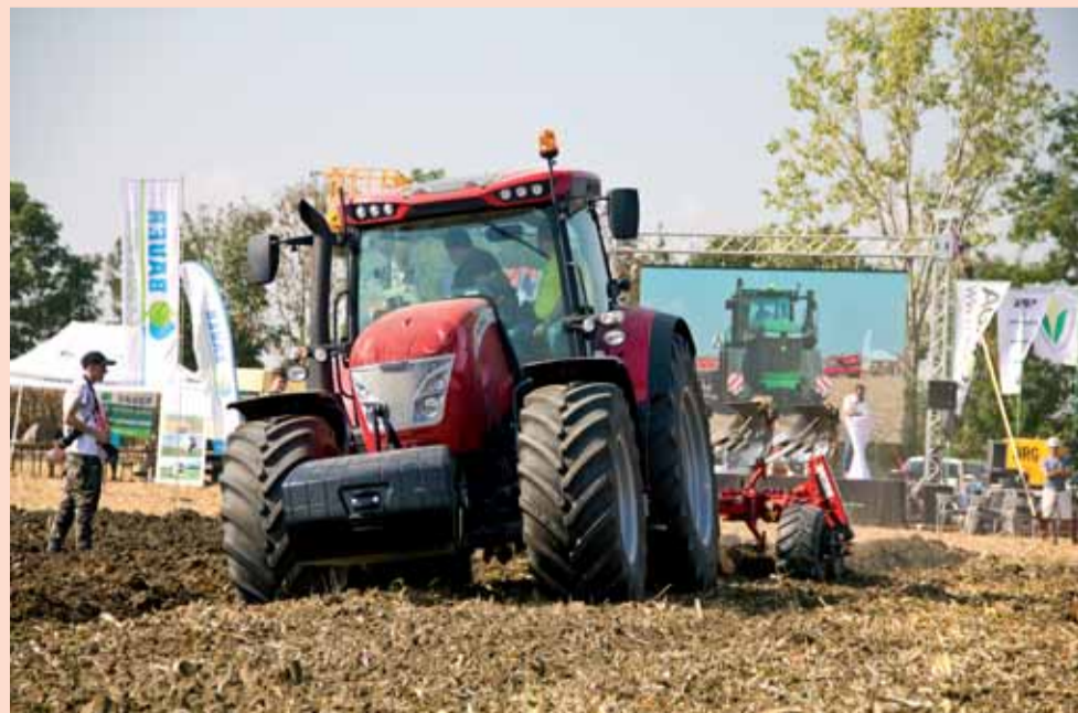
Traktoru McCormick X7 s pluhom Gregoire Besson R6 to išlo veľmi dobre.