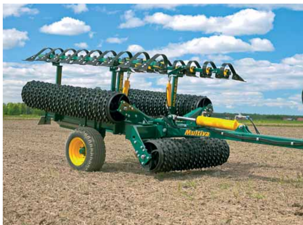
Multiva Rumbler v prepravnej polohe. Použité sú pneumatiky o rozmere 400/15,5.