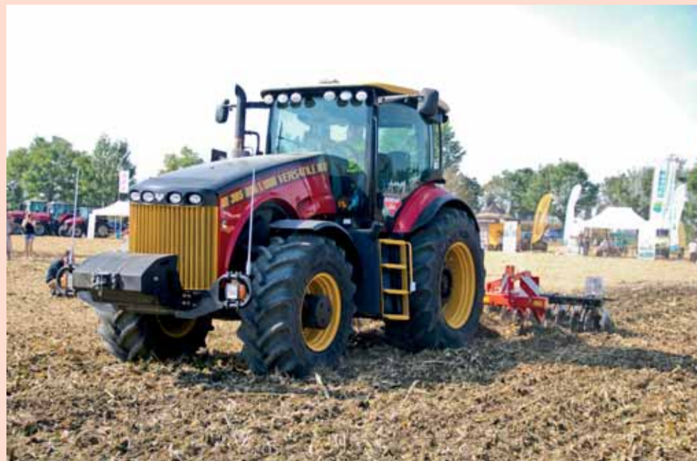
Traktor Versatile 365 s podryvákem Gregoire Besson Helios LD900 v plnom nasadení.