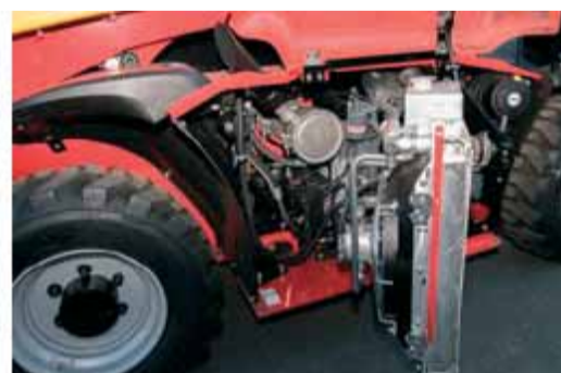
Dokonalý prístup ku všetkým bodom údržby.