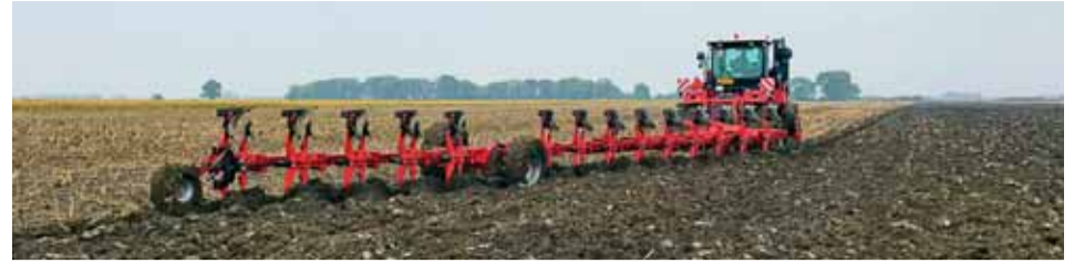
Kvalitná práca po zbere slnečnice bez mulčovania pri hĺbke orby 30 cm.