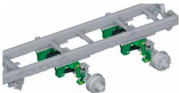
Variabilné uchytenie náprav.