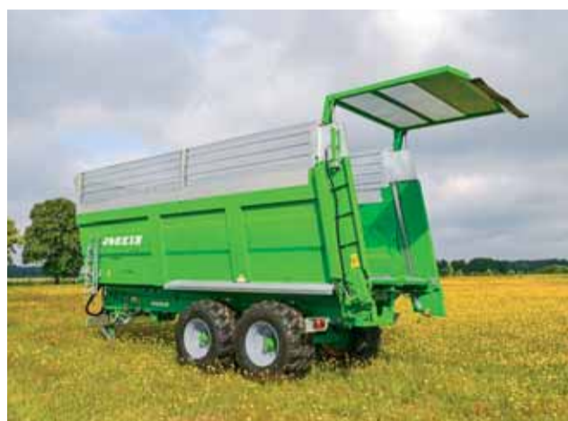
Silážna úprava pre Joskin Ferti-SPACE.

Tento model rozhadzovača môže byť jednoducho prestavaný na náves určený na prevoz siláže. Stačí demontovať závitovky a nahodiť zadné čelo. V tomto prípade sa hodia aj silážne nadstavby pre zväčšenie objemu a 2 rýchlostná prevodovka dopravníka.