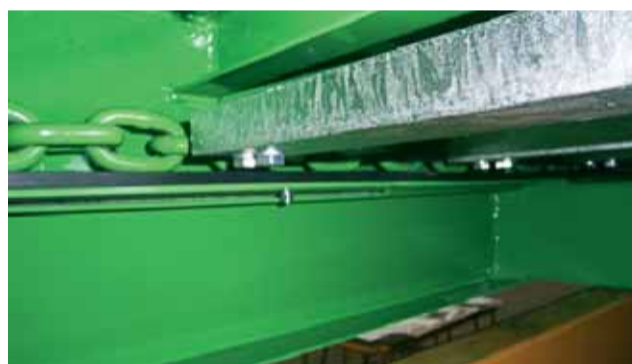
Ertalónové klzné podložky pod dopravníkom.