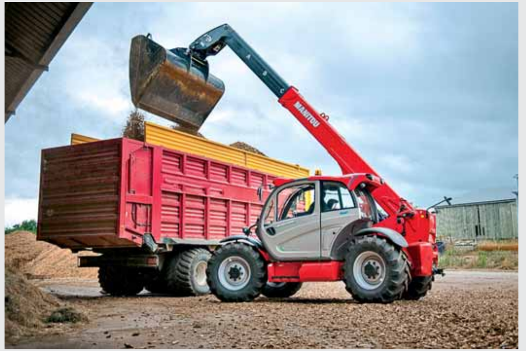
Manitou MLT 840-145 PS postačuje na väčšinu manipulačných úkonov.

„Return To Load“: Automatický návrat do nakladacej polohy na zjednodušenie návratu (príslušenstva a výložníka) do polohy vopred definovanej operátorom. Táto funkcia je zaujímavá predovšetkým pre operácie počas nahládky.