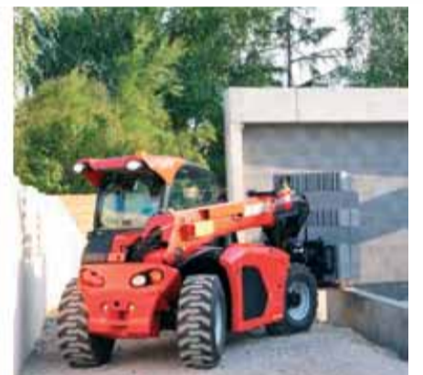
Uplatneniu Manitou MT 420 H Buggy sa medze nekladú.