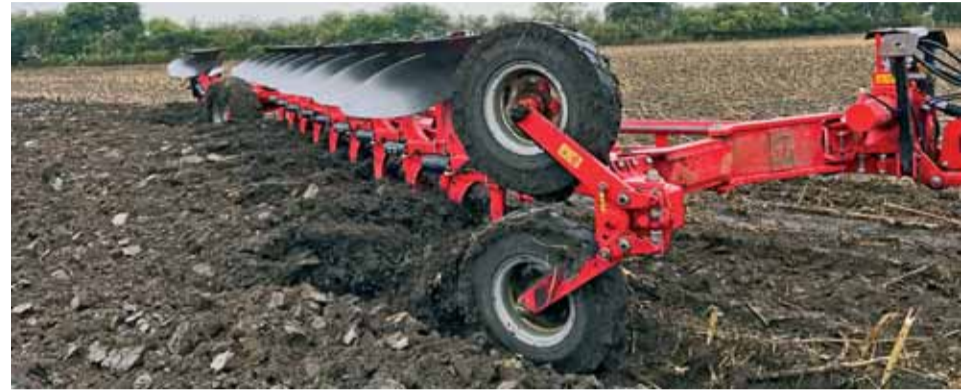
Dokonalé zaklopenie pozberových zvyškov.