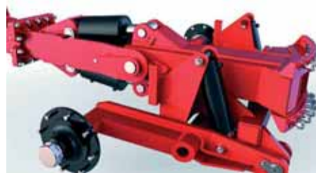
Výnimočnosť pluhu SPHL, hydraulické kopírovanie (resp. pridvihnutie) zadnej časti pluhu.