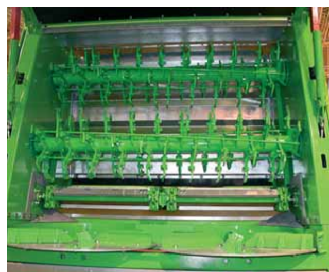
Horizontálne rozhadzovacie ústrojenstvo.