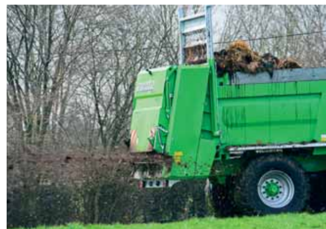
Ferti-SPACE Horizon pri práci.

Horizontálne závitovky v kombinácii s rozhadzovacím stolom umožňujú rovnomerne aplikovať rôzne produkty (maštalný hnoj, kompost, organické odpady, hydínový hnoj) na veľké zábery a to aj pri nízkej dávke do hektára. Závitovky sú poháňané pomocou kardanu s preklzovou spojkou, ktorá chráni celý rozhadzovací mechanizmus.