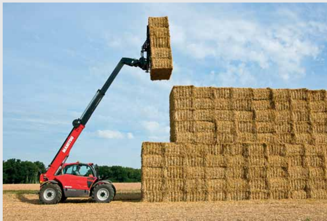
Manitou MLT 1040-145 PS L, pre svoje trojdielne rameno disponuje dosahom až 9,60 m.

„Bucket Shaker“: rýchle vyprázdnenie vytrasením lopaty, bez nutnosti vykonávať opakujúce sa pohyby joystickom.