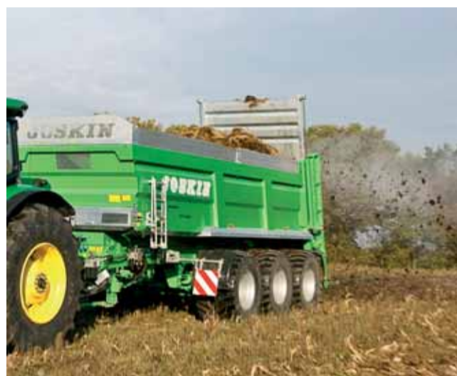
Joskin Ferti-SPACE FS7014/25TRU pri práci.

Korba Ferti-SPACE –u je skonštruovaná z vysoko kvalitnej ocele HLE. Je dostupná v dvoch výškových prevedeniach a to 1050 mm, alebo 1350 mm. Robustné prevedenie korby ponúka kapacitu od 12 do 21 m 3 , čo ho predurčuje na intenzívne používanie. Vďaka veľkému priemeru vertikálnych závitoviek so zaklopenými špirálami dokáže Ferti-SPACE 2 rozhadzovať na šírku od 8 do 16 m. Kontrola a ovládanie sú samozrejme elektro-hydraulické. Jednotlivé funkcie Ferti-SPACE 2 môžu byť riadené systémom Ferti-Control 4000 alebo ISOBUS terminálom. Zákazník si môže zvoliť aj reguláciu dávky na základe rýchlosti alebo dynamický vážiači systém.