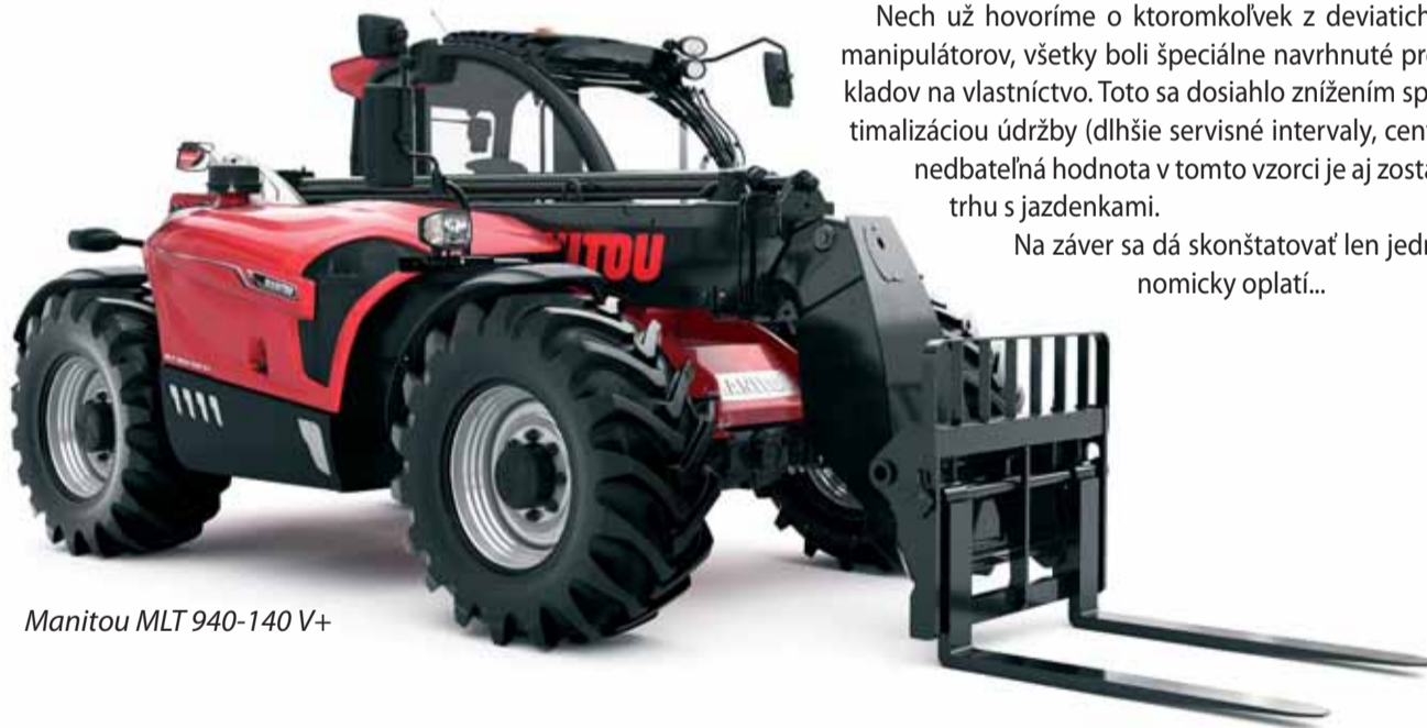
Manitou MLT 940-140 V+