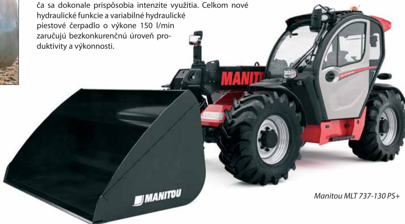
Manitou MLT 737-130 PS+