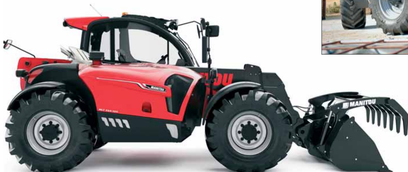
Manitou MLT 733-105