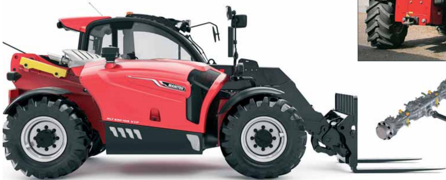
Manitou MLT 630-105 V CP

Pre oba modely je charakteristická zdvihová výška 5,85 m, nosnosť slušných 3000 kg. Na stiesnené prejazdy je zaujímavá celková šírka len 2,06 m. Model CP (compact) má celkovú výšku len 2,11 m, čo je o celých 26 cm menej ako u MLT 630-105 V v štandardnom prevedení. CPčko to dosiaholo nižším umiestnením kabíny. Oba modely sú poháňané motorom Deutz s výkonom 101 HP a o hydraulické pohyby sa stará zubové čerpadlo s výkonom 104 l/min.