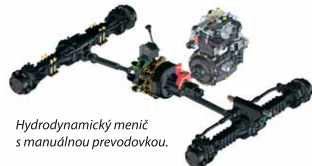
Hydrodynamický menič s manuálnou prevodovkou.