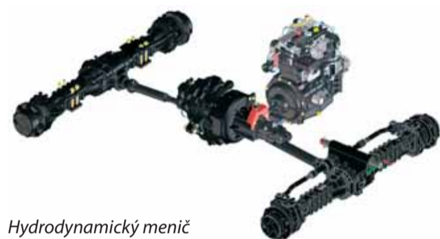
Hydrodynamický menič s prevodovkou Powershift.