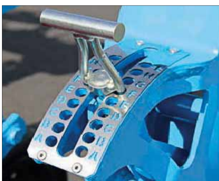
Nastavenie hĺbky pomocou jednoduchého mechanizmu