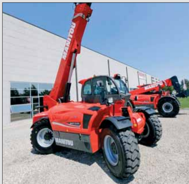
MHT 10180 má nosnosť 18 ton a max. zdvihovú výšku 9,63 m.