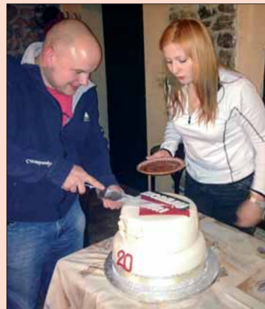
Nechýbala ani torta špeciálne vyrobená pre túto udalosť.

Toto významné jubileum firmy sme oslávili ako sa patrí. Všetci zamestnanci a spolupracovníci spoločnosti Moreau Agri sa zišli na tradičnej zabíjačke v Čičmanoch. Popri sledovaní umenia starých mäsiarskych majstrov bolo stále aj čo ochutnávať a viesť príjemné rozhovory. K príjemnej atmosfére prispievala miestna cimbalová muzika a samotné miesto – obec Čičmany dýchajúce históriou a odkazom našich predkov. Na záver sa nedá nič iné skonštatovať, iba že akcia sa dokonale vydarila a už teraz sa tešíme na blížiacu sa štvrtstoročie našej firmy a oslavy s tým spojené.