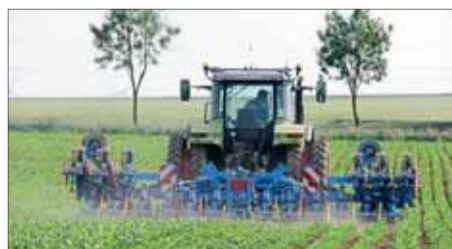
12-riadková repná verzia pri sklopení krajných sekcií