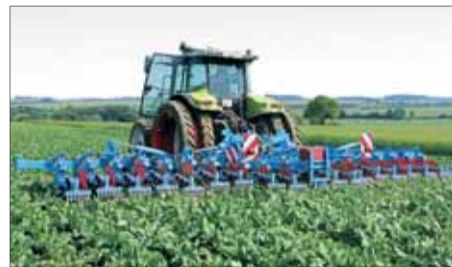
18-riadková repná verzia