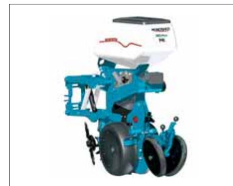
Jednotka NG Plus Me