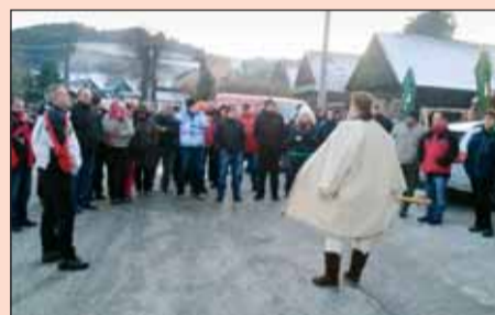
Prehliadku Čimán vďaka pútavému a autentickému výkladu sme si všetci pochvalovali.