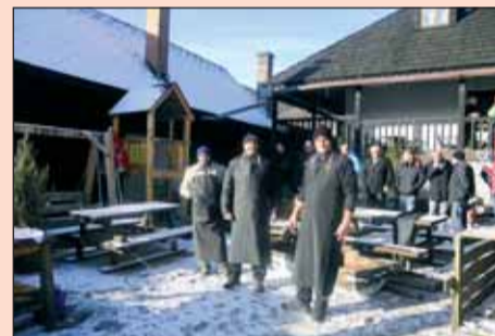
Do zabíjačky sa niektorí z nás aktívne zapojili.